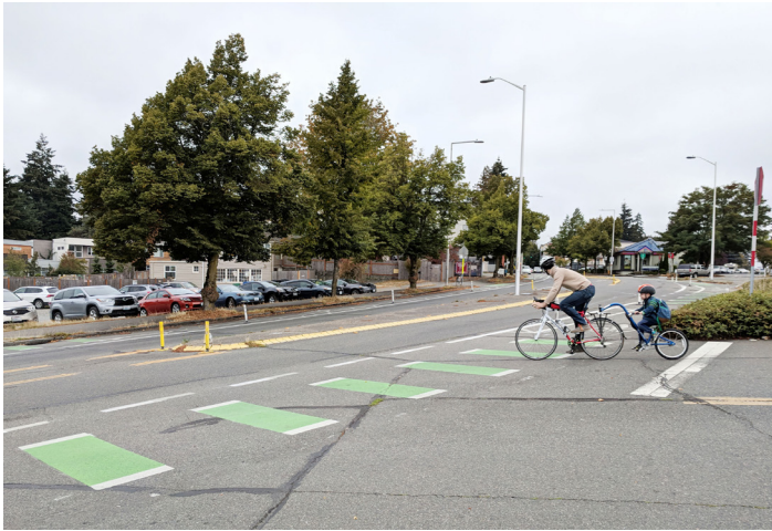
አሁን ያለው የመታየት ሁኔታ፣ አቅጣጫ ጥቆማ እና የመሻገሪያ ችግሮች፡ በ Pinehurst Way NE እና NE 117th St ወደሰሜን

ለትርጉም እና አስተርጓሚ እገዛዎ (206) 316-2549 ላይ ይደውሉ