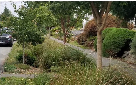
Завершенная естественная дренажная система на жилой улице.